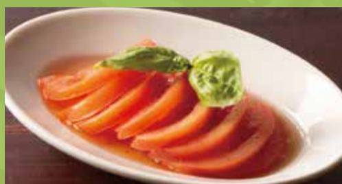
Marinated Tomato 400