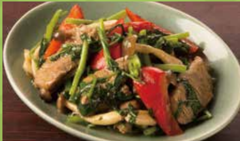
Wok-fried Beef, Water Spinach & Bell Pepper with Fish Sauce