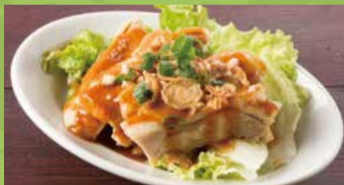
Steamed Chicken Sesame Sauce 500