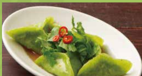
Spinach Gyoza with Coriander

ほうれん草の水餃子 パクチー添え 550 ヌクナムとパクチーの香りが良く合う海老入り餃子