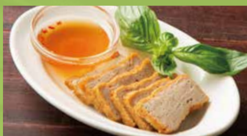
Vietnamese Fried Pork Ham 500