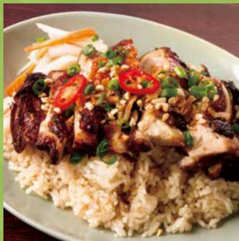
Vietnamese Chicken Rice