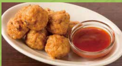
Calamari Cake 500