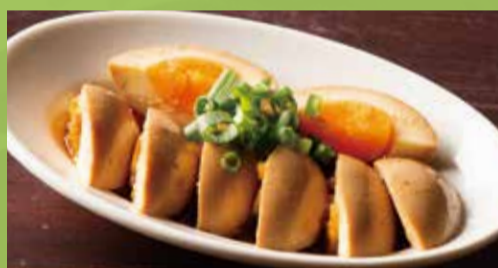
Seasoned Boiled Egg 400