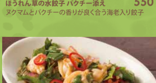
Clam Mixed with Asian Basil & Sweet Chili Sauce 550

ほうれん草の水餃子 パクチー添え 550 ヌクナムとパクチーの香りが良く合う海老入り餃子