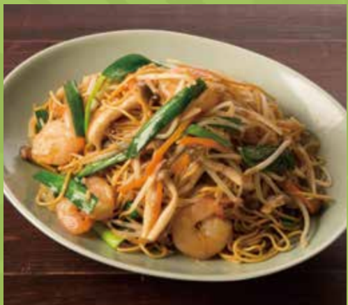
Chow Mein with Shrimp & Vegetables 1,200

ブンボーフェ 【ピリ辛スープの丸麺】ベトナムの都市フエで 親しまれている牛のブンのピリ辛仕立て