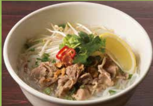
Cellophane Noodles Soup with Thin Sliced Beef 1,300