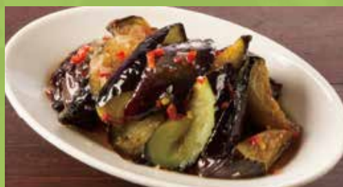
A Little Hot Deep-fried Eggplant