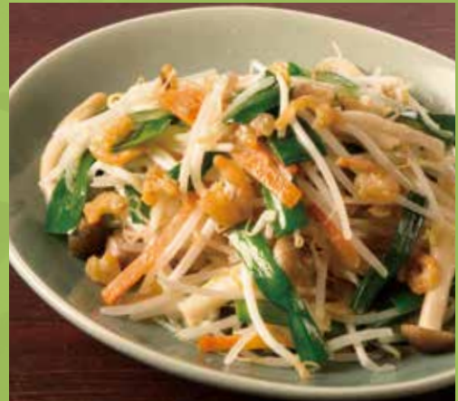
Wok-fried Bean Sprouts & Dried Shrimp with Soy Sauce 850