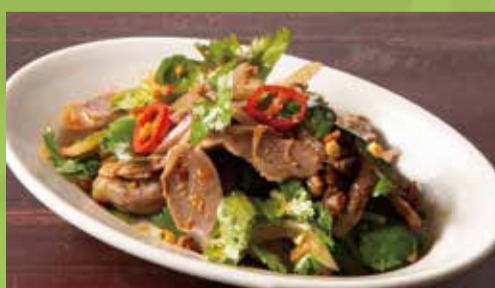
Spicy Cilantro & Jizzard 550