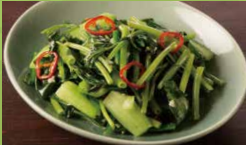
Wok-fried Water Spinach, Bokchoy & Garlic with Fish Sauce 1,000