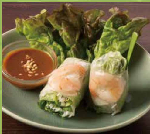
Raw Summer Rolls with Peanut Sauce 600

Shrimp, Pork, Rice Vermicelli, Lettuce & Garlic Chive