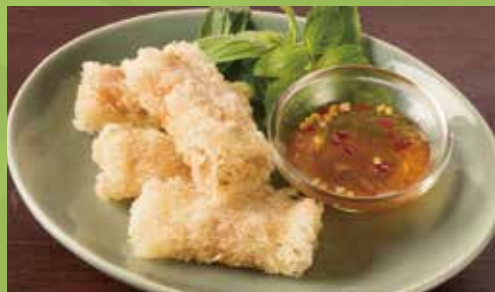
Crispy Spring Rolls with Sweet-sour Sauce 600