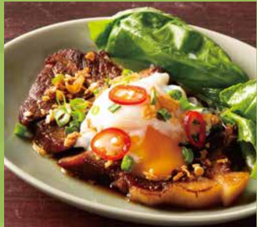
Vietnamese Stewed Pork with Egg 950