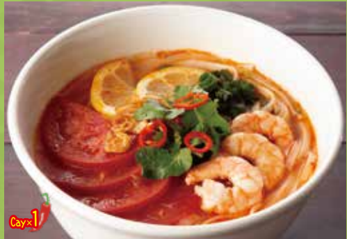
Cellophane Noodles Soup with Shrimp & Tomato 1,200