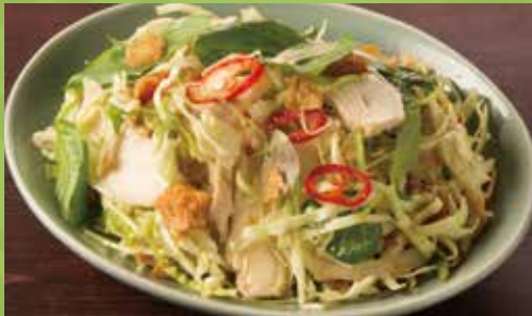
Vietnamese Chicken Salad with Crispy Asian Slaw 850