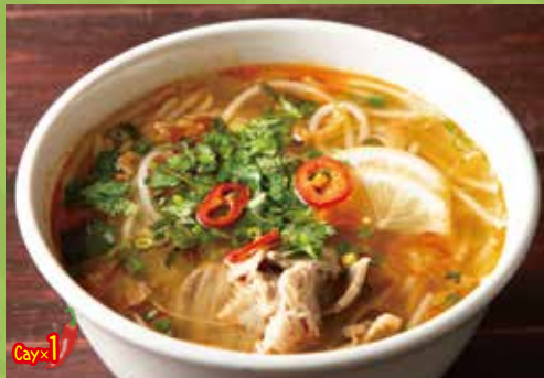
"Hue Style" Spicy Rice Noodles with Thin Sliced Beef 1,300

ブンボーフェ 【ピリ辛スープの丸麺】ベトナムの都市フエで 親しまれている牛のブンのピリ辛仕立て