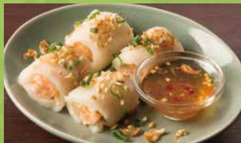
Steamed Spring Rolls with Sweet-sour Sauce 600