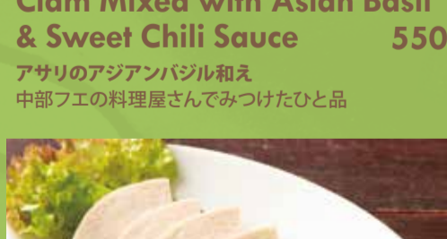
Vietnamese Pork Ham 500