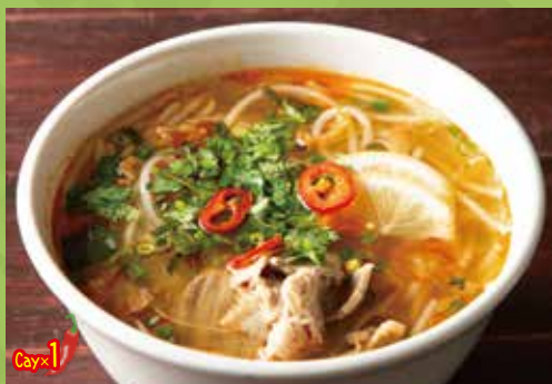
"Hue Style" Spicy Rice Noodles with Thin Sliced Beef 1,300

ブンボーフェ 【ピリ辛スープの丸麺】ベトナムの都市フエで 親しまれている牛のブンのピリ辛仕立て