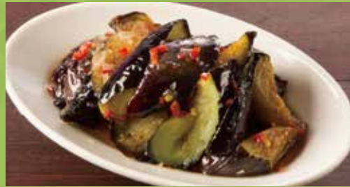
A Little Hot Deep-fried Eggplant