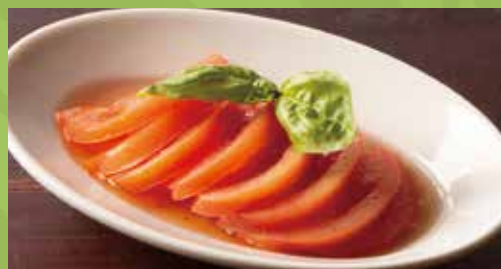
Marinated Tomato 440