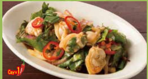
Clam Mixed with Asian Basil & Sweet Chili Sauce 590