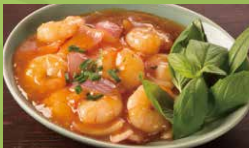
Wok-fried Shrimp & Onion with Tamarind-chili Sauce 1,300

海老とハーブのお好み焼き“バンセオ” たっぷり葉野菜で巻いて食べるホーチミン名物