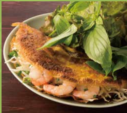
Crispy Pancake with Shrimp, Pork & Asian Herbs 1,200

海老とハーブのお好み焼き“バンセオ” たっぷり葉野菜で巻いて食べるホーチミン名物