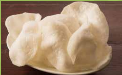
Shrimp Crackers 440