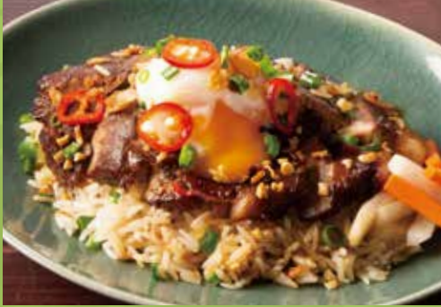
Vietnamese Stewed Pork with Egg on Rice 1,140