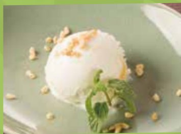
Coconut Ice Cream 490 ココナッツアイス パイナップルが入った アジアンテイスト