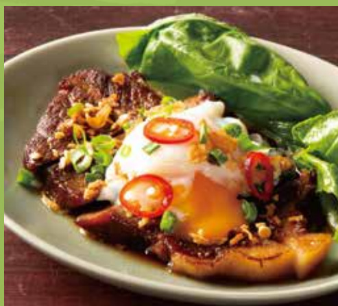
Vietnamese Stewed Pork with Egg 1,040