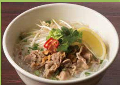
Cellophane Noodles Soup with Thin Sliced Beef 1,300