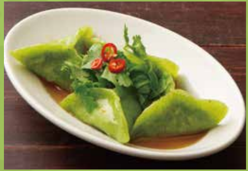
Spinach Gyoza with Coriander

ほうれん草の水餃子 パクチー添え 590 ヌクナムとパクチーの香りが良く合う海老入り餃子