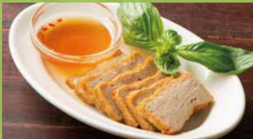
Vietnamese Fried Pork Ham

ほうれん草の水餃子 パクチー添え 590 ヌクナムとパクチーの香りが良く合う海老入り餃子