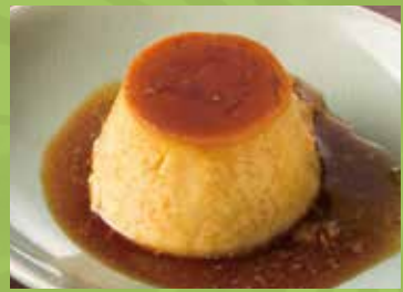
Vietnamese Pudding 600 ベトナムプリン ちょっと固めの しっかりベトナムプリン

The prices are including consumption tax.