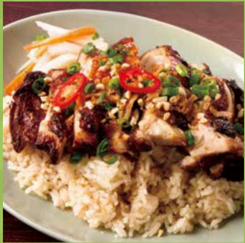
Vietnamese Chicken Rice 鶏飯“コムガー” 1,090 シクロのロングセラー。ジューシーでやわらか