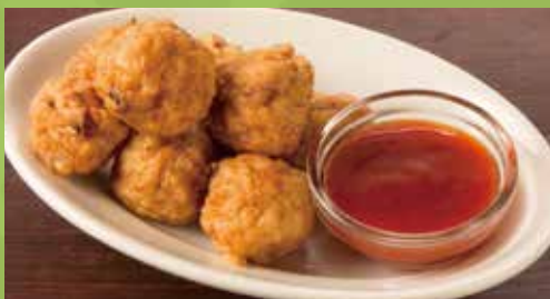
Calamari Cake 540