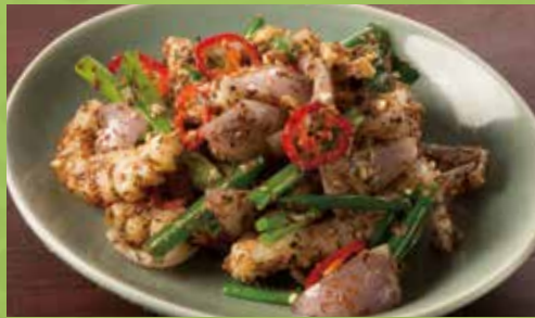
Wok-fried Calamari with Onion, Scallion & Lemongrass 990