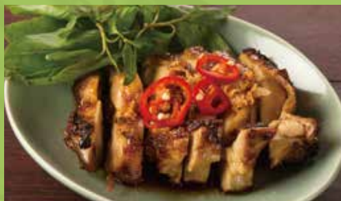
Deep-fried Chicken Marinated with Coconut Water 990