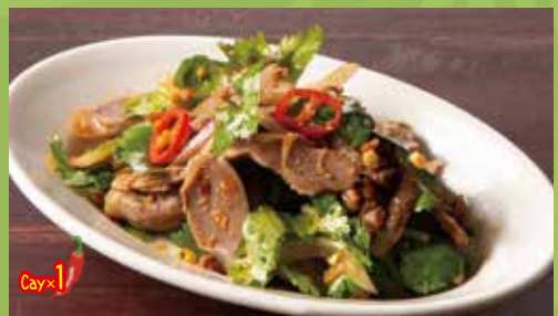
Spicy Cilantro & Jizzard