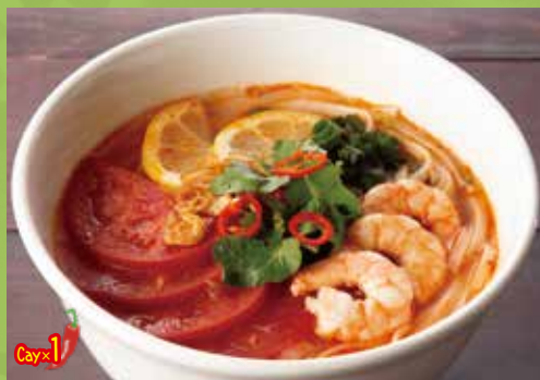
Cellophane Noodles Soup with Shrimp & Tomato 1,200