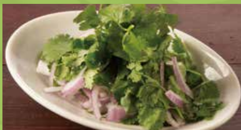
Cilantro & Red Onion 590