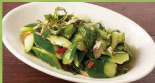
Cucumber with Sweet Chili Sauce