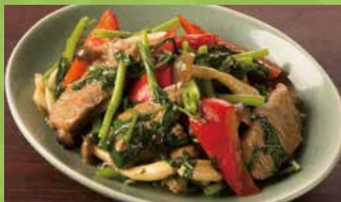
Wok-fried Beef, Water Spinach & Bell Pepper with Fish Sauce 1,090