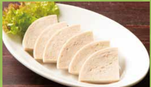
Vietnamese Pork Ham 540