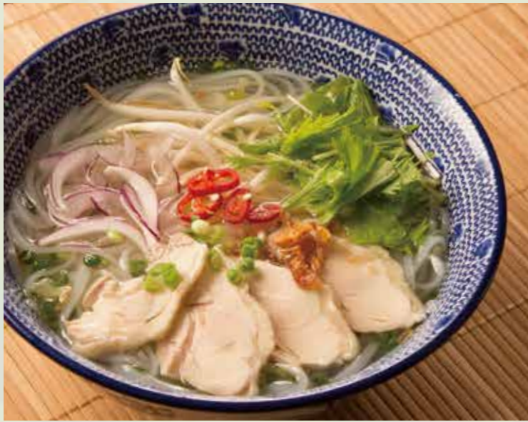
蒸し鶏のフォー 900 Cellophane noodle with steamed chicken