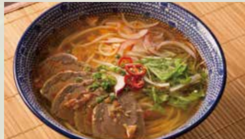
牛肉のブン【旨辛スープの丸麺】 990 Rice noodle with beef