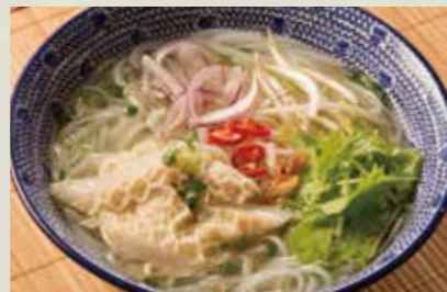
モツのフォー 990 Cellophane noodle with offal