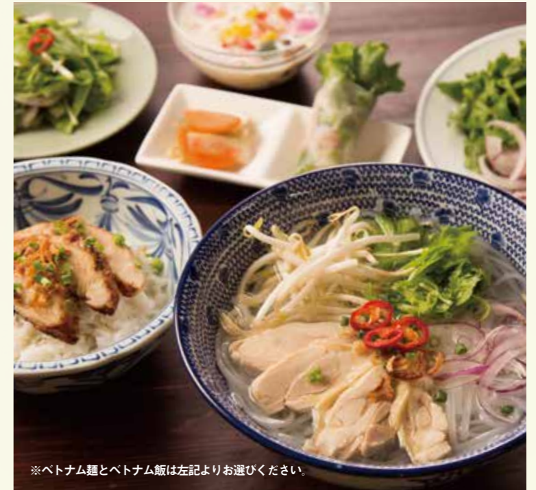
※ベトナム麺とベトナム飯は左記よりお選びください。