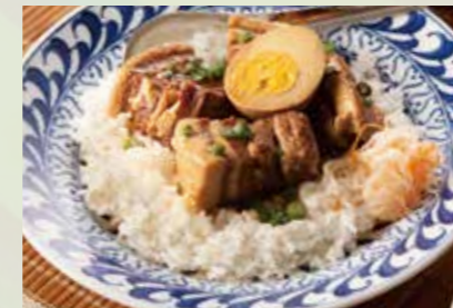
豚のベトナム角煮ごはん 990 Vietnamese stewed pork belly rice