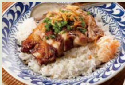
コムガー【ベトナム鶏飯】 950 Vietnamese chicken rice