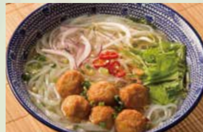
肉団子のフォー 990 Cellophane noodle with meatballs