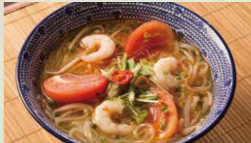
海老とトマトのブン【旨辛スープの丸麺】 990 Rice noodle with shrimp and tomato