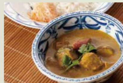
ベトナムチキンカレー 990 Vietnamese chicken carry