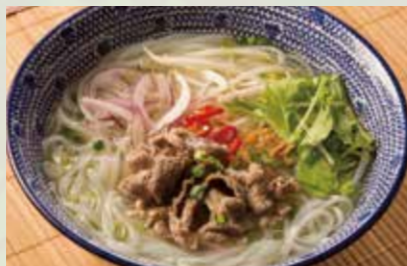
牛肉のフォー 990 Cellophane noodle with thinly sliced beef