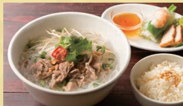
Beef Pho Set