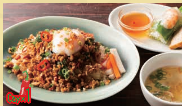
Stir-fried Minced Pork & Basil on Rice Set