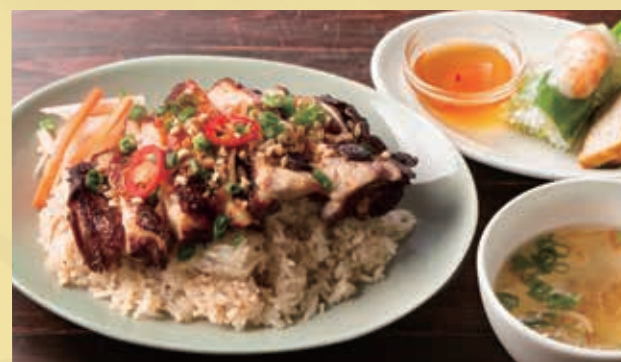
Vietnamese Chicken Rice Set