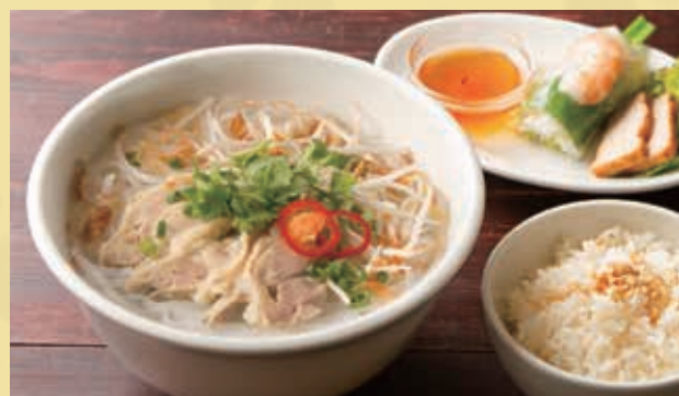
Chicken Pho Set