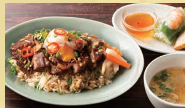
Vietnamese Stewed Porkon Rice Set