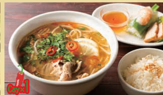
Bun Bo Hue Set