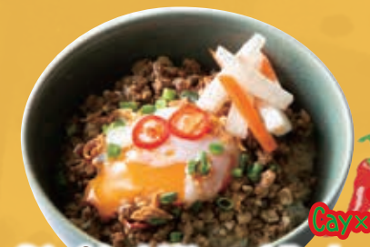
Stir-fried Minced Pork & Basil with Egg