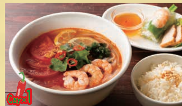
Shrimp & Tomato Spicy Pho Set